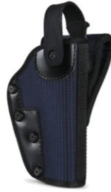
FONDINA RFX (cod. FRFXB9L)