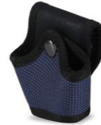
PORTAMANETTE APERTO RFX (cod. PMARFXB)