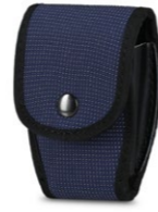
PORTAMANETTE CHIUSO RFX (cod. PMCRFXB)