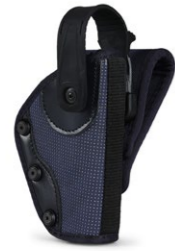
FONDINA E.R. RFX CORTE (cod. FRFXB9C)